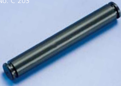
Scharnierachse (2) Hinge Pin (2) Art.-No. C 203