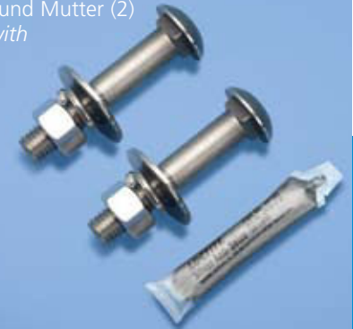
Brettschraube mit Scheibe und Mutter (2) Board Bolt with Washer and Nut (2) Art.-No. SF 122/135