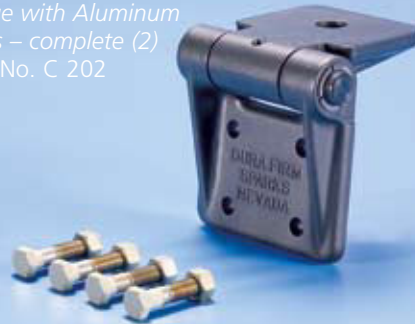
Komplettes Scharnier (Teil 1-3) mit Befestigungsschrauben (2) Hinge with Aluminum Bolts – complete (2) Art.-No. C 202