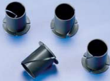
Nylonbuchse (8) Nyliner (8) Art.-No. C 209