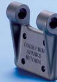
Scharnierteil B (2) Hinge Part B (2) Art.-No. C 202 B