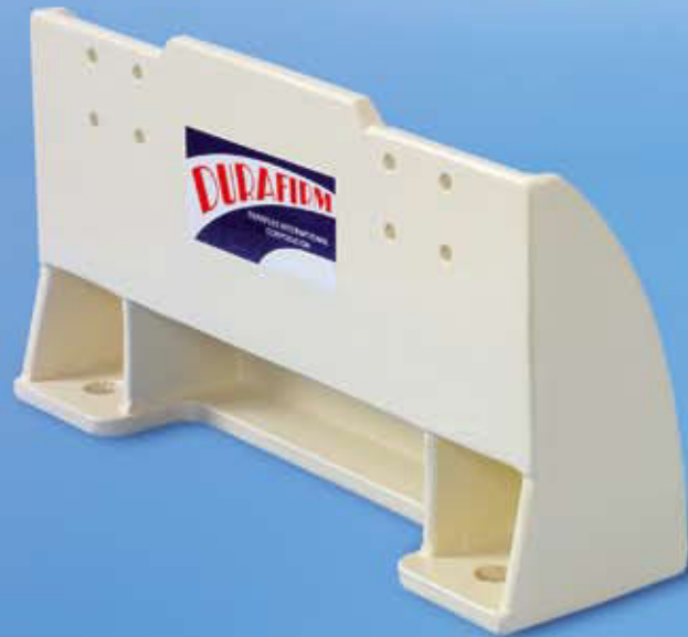
Endlager Short-Stand Anchor-Fitting Art.-No. SB-501-E